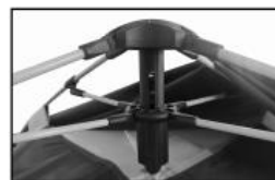
顶端伞状液压装置