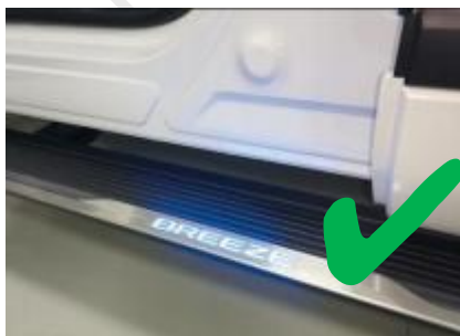
正常状态 (开门伸出)