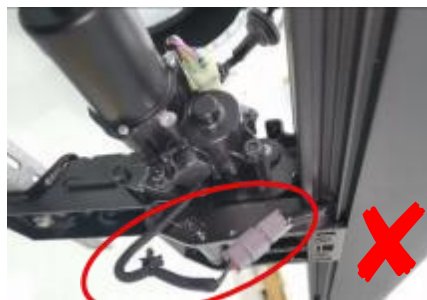
未有效固定线束，损坏线束