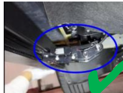
规范安装线束支架, OK